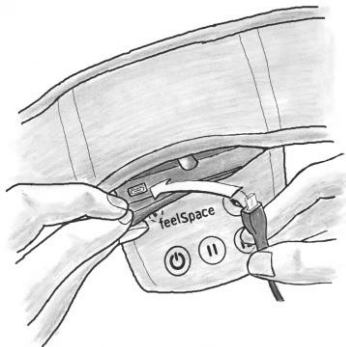
Abbildung 3: Aufladen des Gürtels über Micro-USB

Laden Sie den naviGürtel® vor der ersten Verwendung vollständig auf. Verwenden Sie hierzu das mitgelieferte Ladegerät. Legen Sie den Gürtel für den Ladeprozess ab. Stecken Sie den Micro-USB-Stecker des Ladegeräts in die Micro-USB-Buchse am oberen Rand des Bedienelements. Sie erreichen die Buchse von außen über eine Öffnung in der Bedientasche. Biegen Sie die Bedientasche etwas auf, damit sie die obere Kante des Bedienelements erfühlen können. Auf der Seite der Ein-/Aus-Taste befindet sich die Micro-USB-Buchse. Um das Ladegerät richtig mit dem Gürtel zu verbinden, orientieren Sie sich an der Prägung auf dem USB-Stecker. Diese Prägung sollte in Richtung der Tasten zeigen, damit der Stecker die richtige Orientierung zum Einstecken hat.